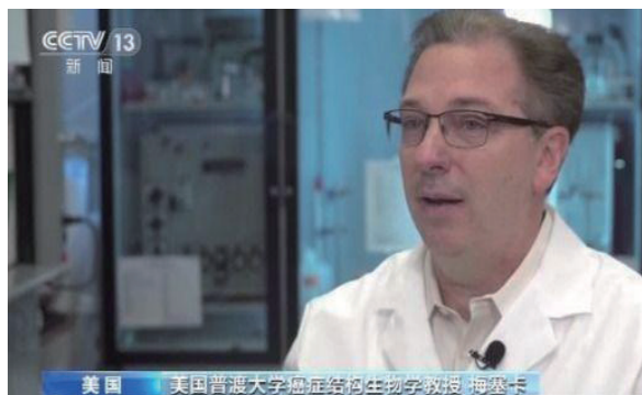
美國普渡大學癌症結構生物學教授 梅塞卡