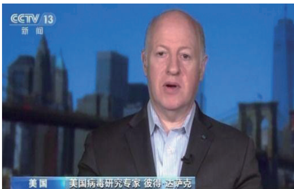
美國病毒研究專家 彼得·達薩克：從疫情

英國愛丁堡大學研究員 克里斯汀：（在對抗疫情這方面）中國非常透明和開放。政府很迅速地實施隔離措施，毫無疑問將減緩病毒的傳播，有助於控制疫情。我認為中國政府針對此次疫情非常負責任，在非典疫情之後有很多經驗。我想這肯定會對控制此次疫情有幫助。