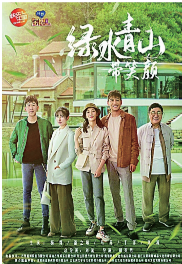
電視劇《綠水青山帶笑顏》海報 資料圖片

另外，高長力司長在賀信中兩次提到電視劇高質量發展，為行業的發展指明了方向。當下的電視劇市場不再以量取勝，轉而從質出發，在制作上呈現出類型多元、現象接踵、創新不斷的勢態；在內容上注重更為合理、合情的故事邏輯構建，個性鮮明的人物形象塑造以及傳遞正向、積極、健康的價值觀。