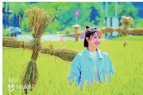
電視劇《我們在夢開始的地方》劇照 資料圖片

在春交會的“青年制作人論壇”上，靈河文化傳媒有限公司的創始人、CEO白一聽指出：“對所有的制作者來說，如何預設並找到觀眾想要看什麼很重要。我們要站在觀眾的角度去思考問題，盡量挖掘觀眾需求。疫情讓我們開始冷靜思考未來該如何發展，我們得出的結論是，未來仍然是優質內容占據頭牌時代，挖掘觀眾需求、了解觀眾的喜好對於之后的發展非常重要。”