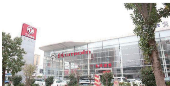
東風鴻泰 4s 店

10 月 21 日，劉先生駕車來到位於凱里經濟開發區經緯國際汽車城內的東風鴻泰 4s 店接受處理。