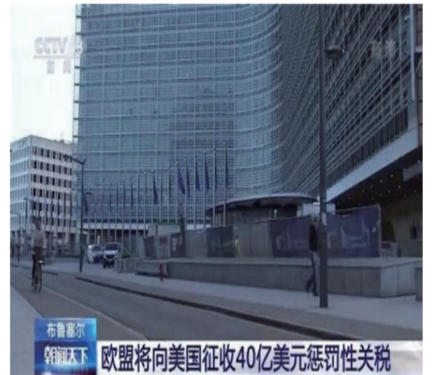
布魯塞爾 新聞天下 歐盟將向美國征收40億美元懲罰性關稅

東布羅夫斯基表示，由於美國和歐盟的航空業補貼爭端，在世界貿易組織作出裁決後，美國已經開始對歐盟征收關稅；現在，歐盟也擁有世貿組織對波音公司案的裁決，因此也可以征收懲罰性關稅。目前，這一征收關稅的決定已經得到歐盟成員國的同意。