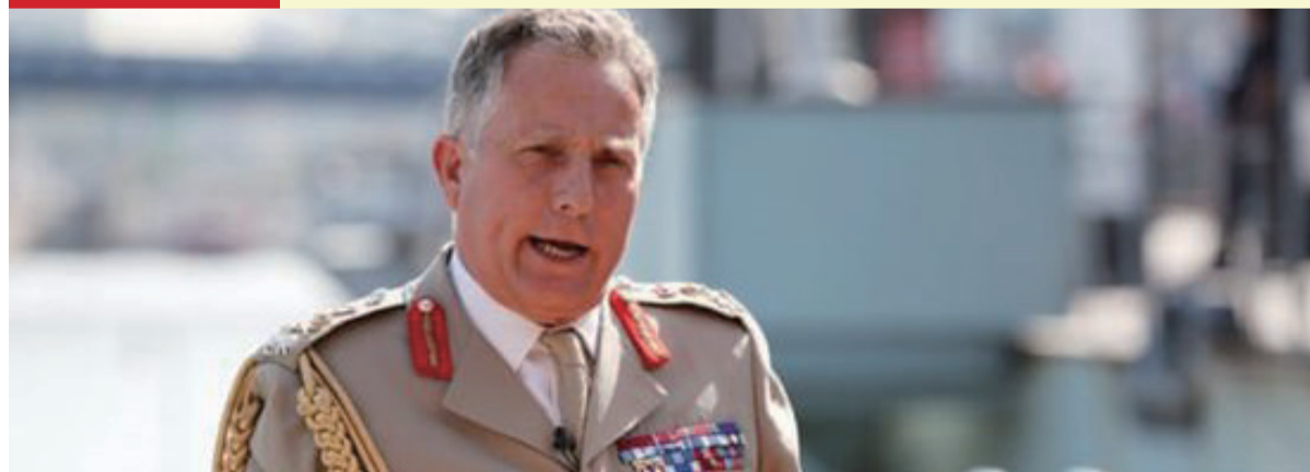
英國軍方總參謀長卡特 (Carter) 表示，到 2030 年英國將有 3 萬名機器人士兵與前綫內外戰鬥人員并肩作戰。（網絡截圖）

【大公文匯全媒體】當地時間 8 日，英國軍方總參謀長卡特 (Carter) 表示，到 2030 年英國將有 3 萬名機器人士兵與前綫內外戰鬥人員并肩作戰。