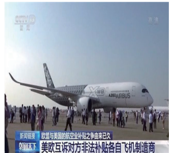
新聞链接 歐盟與美國的航空業補貼之爭由來已久 新聞天下 美歐互訴對方非法補貼各自飛機制造商

歐盟與美國的航空業補貼之爭已經持續了 16 年。2004 年，美國向世貿組織提出訴訟，指控歐盟以各種形式向空中客車公司提供非法補貼，而歐盟隨後也向世貿組織起訴美國政府向波音公司提供非法補貼。