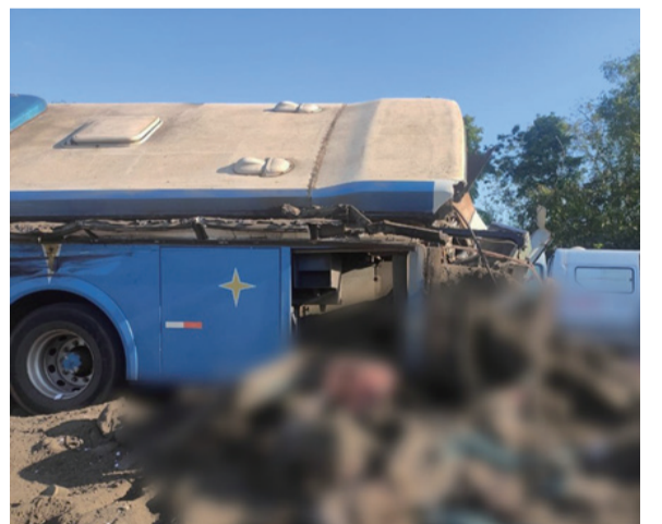
車禍現場

巴西聖保羅州當地時間 25 日早發生一起重大交通事故，目前已造成至少 41 人死亡，另有多人受傷。