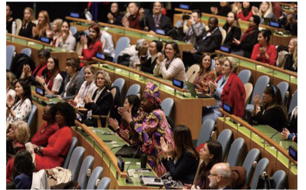
聯合國婦女署副總干事安妮塔·巴蒂亞稱，“僅在 9 月份，美國就有約 86.5 萬名女性退出勞動市場。”

【大公文匯全媒體】當地時間 26 日，聯合國婦女署最新的全球數據顯示，新冠疫情可能會讓他們為之努力的性別平等工作倒退 25 年。