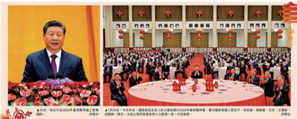
圖:左圖:30日,習近平在2022年春節團拜會上發表講話。右圖:1月30日,中共中央、國務院在北京人民大會堂舉行2022年春節團拜會。黨和國家領導人習近平、李克強、栗戰書、汪洋、王滬寧、趙樂際、韓正、王岐山等同首都各界人士歡聚一堂,共迎新春。

【大公網】大公報訊,中共中央、國務院30日上午在人民大會堂舉行2022年春節團拜會。中共中央總書記、國家主席、中央軍委主席習近平發表講話,代表黨中央、國務院,向全國各族人民,向香港特別行政區同胞、澳門特別行政區同胞、臺灣同胞和海外僑胞拜年,祝大家身體健康、闔家幸福、萬事如意、虎年吉祥。習近平強調,世界上最大的幸福莫過于為人民幸福而奮鬥,心中裝着百姓,手中握有真理,腳踏人間正道,我們信心十足、力量十足。