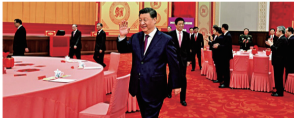
1月30日,中共中央總書記、國家主席、中央軍委主席習近平等黨和國家領導人在春節團拜會上向大家揮手致意,同大家互致問候、祝福新春。

習近平在講話中指出,即將過去的農曆辛丑年,是我們總結歷史、回顧既往的一年,也是我們致敬歷史、面向未來的一年。全黨全國各族人民發揚孺子牛、拓荒牛、老黃牛精神,繼續為中華民族偉大復興辛勤奮鬥,推動黨和國家事業取得了新的顯著成就。我們隆重慶祝中國共產黨成立一百周年,禮序乾坤、樂和天地,擊鼓催徵、奮楫揚帆,激發了全黨全社會奮進新時代的磅礴力量。我們召開黨的十九屆六中全會并作出第三