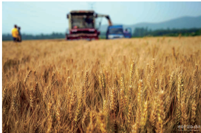
2022年6月19日,河北省遵化市劉備寨鄉的農民將收穫的小麥裝車。

【新華網】小暑節氣,廣袤農田一片繁忙景象。南方稻區早稻開始收穫、晚稻抓緊栽插,東北、華北等地農民辛勤勞作,做好玉米、水稻、大豆等田間管理。