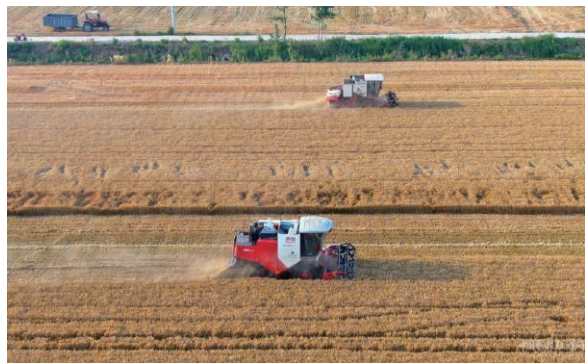
2022年6月8日,在河南省安陽市湯陰縣菜園鎮高標準農田示範區,收割機在麥田作業(無人機照片)。