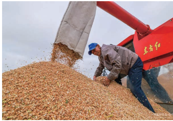
2022年6月20日,在山東省榮成市滕家鎮東灘郭家村的小麥田裏,村民在收穫小麥。

春爭日,夏爭時。目前,南方早稻已開始收割,晚稻預計8月上旬栽插結束,夏玉米、夏大豆播種已經落地。秋糧面積穩中有增,長勢總體正常。農業農村部門將指導各地立足抗災奪豐收,再戰100天,全力以赴奪取秋糧和全年糧食豐收。