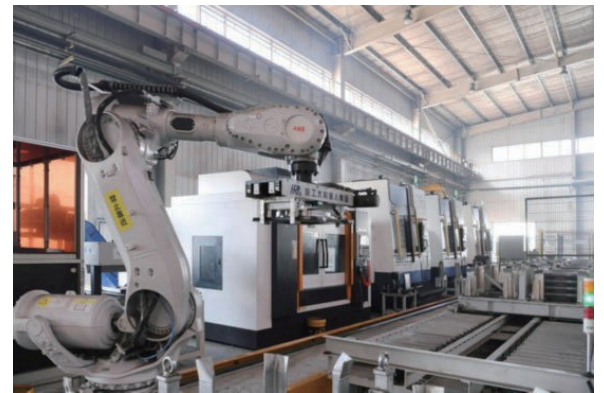
中車齊車上心盤智能化生產線。

集團在運營質量、發展安全、創新轉型等各方面取得了顯著成效，近5年研發投入年均增長28.76%，2022年上半年利潤總額同比增長15.14%。