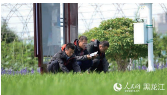
建三江國家農業科技園區科研人員在做田間檢測。

黑龍江省考察時提出，要加快綠色農業發展，堅持用養結合、綜合施策，確保黑土地不減少、不退化。