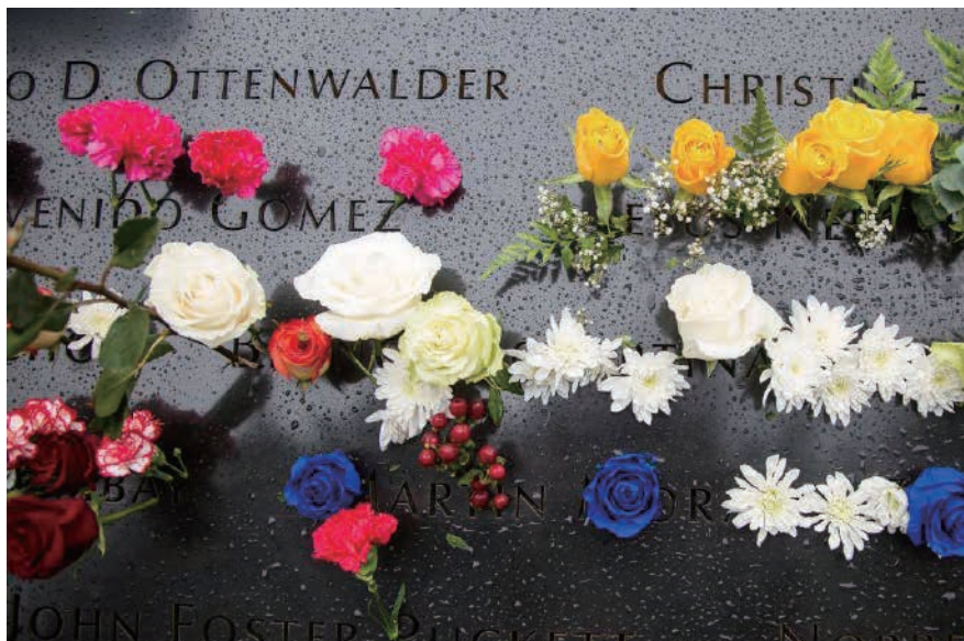
9月11日，在美國紐約的“9·11”紀念廣場，鮮花擺放在紀念池邊刻有遇難者姓名的銅牌上。

2001年9月11日，恐怖分子劫持4架民航客機，對美國境內目標展開自殺式襲擊，其中兩架分別撞上世貿中心雙子塔，一架撞上位于弗吉尼亞州阿靈頓縣的五角大樓一角，另外一架墜落在賓夕法尼亞州鄉野。這一系列襲擊共造成約3000人死亡。