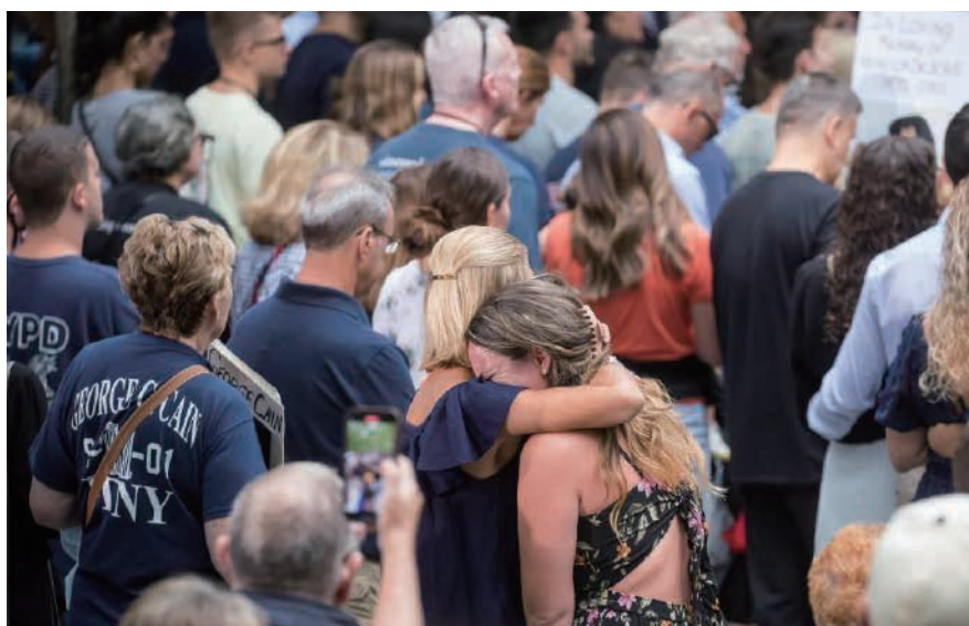
9月11日，人們在美國紐約參加“9·11”事件21周年紀念活動。

【新華網】新華社華盛頓9月11日電（記者孫丁）美國多地11日舉行活動，悼念2001年“9·11”恐怖襲擊事件中的遇難者。