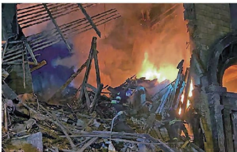
烏克蘭扎波羅熱地區近日連遭導彈襲擊。

拜登的發言引發歐洲關切。在布拉格出席歐洲政治共同體峰會的法國總統馬克龍表示：“當評論這種事時，我們必須審慎發言。”