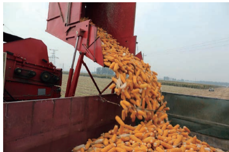
在河北省邢臺市南和區一處大豆玉米帶狀復合種植基地，農民將收穫的玉米裝車。