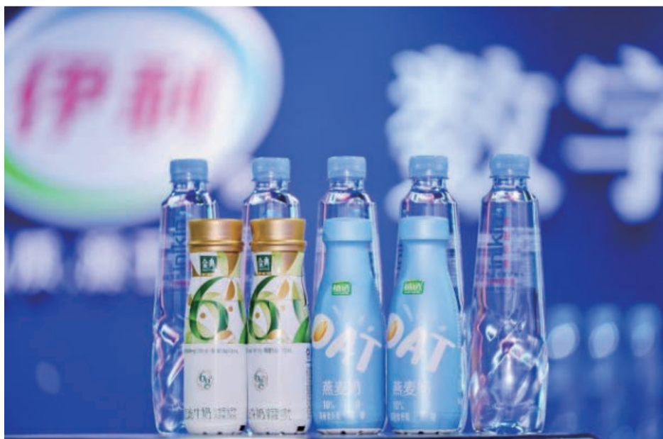
本屆世界互聯網大會烏鎮峰會的伊利三款指定產品