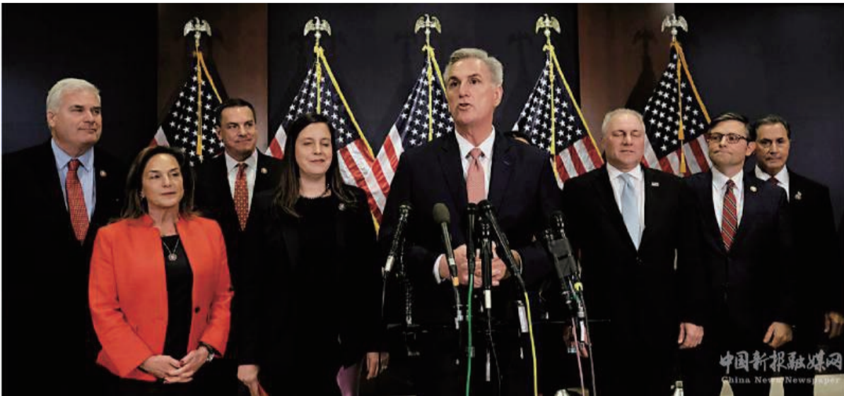
眾議院共和黨領袖麥卡錫（中）15日在國會大廈見記者。

【大公報】綜合 CNN、Politico 新聞網、《華爾街日報》報道：截至當地時間 17 日，美國中期選舉計票結果顯示，共和黨率先拿下 218 個國會眾議院席位，重奪眾議院控制權。此前民主黨已鎖定參議院多數黨地位。國會參眾兩院分屬兩黨，府會分治意味着未來兩年拜登政府的很多議程很難在國會推進。據悉，眾議院共和黨人已將調查拜登政府列為優先任務，包括拜登之子亨特的海外生意往來、美軍撤出阿富汗、司法部政治化等多項議題。