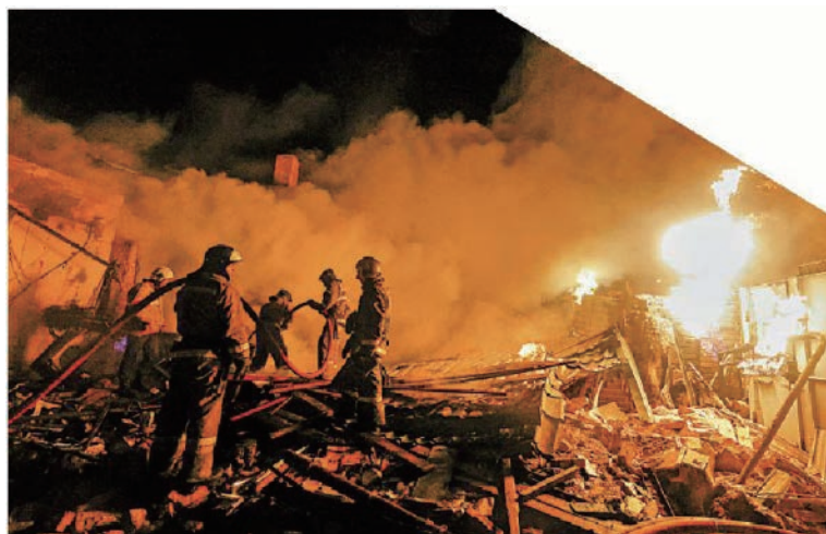
烏克蘭東部頓涅茨克地區遭轟炸，消防員 9 日救火。

白宮國家安全委員會發言人柯比表示，美國將再向烏克蘭提供 2.75 億美元軍援，以強化空防和擊落無人機。