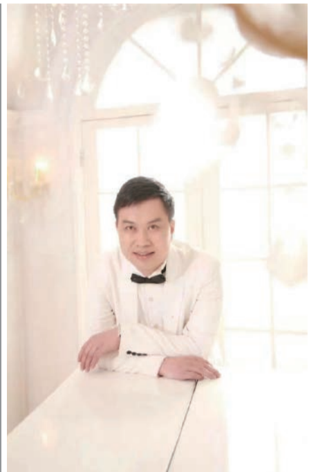
（本報評論員 婁義華）