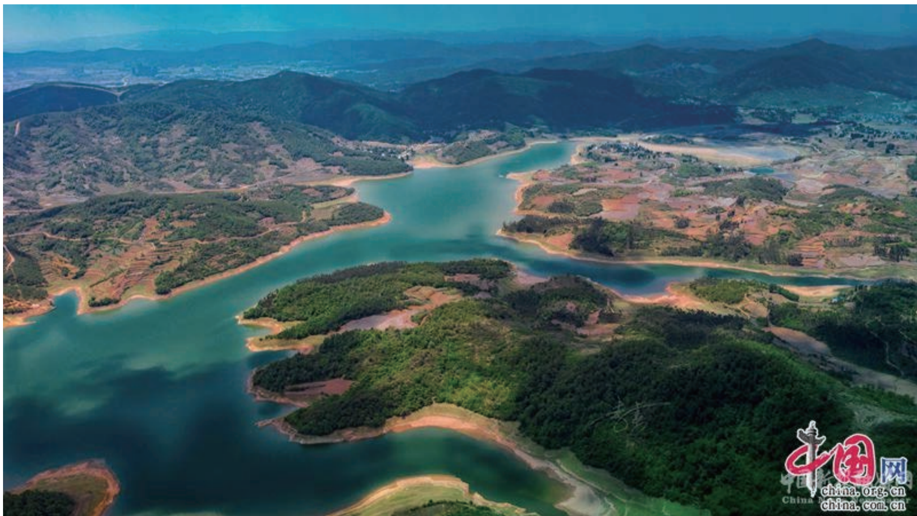
西河水庫