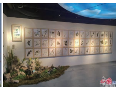
宣教中心