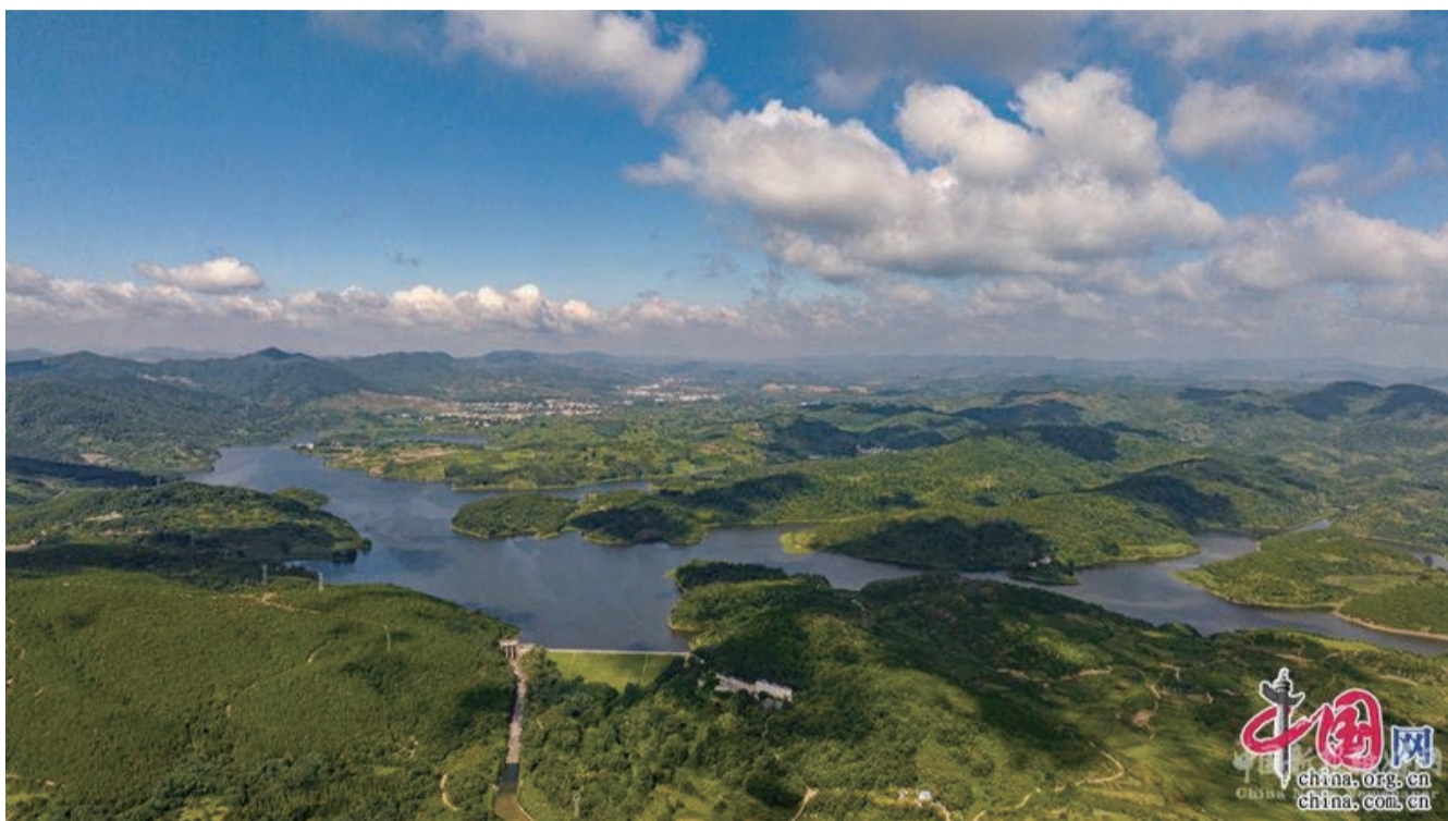
西河水庫 沾益西河國家濕地公園管理處供圖