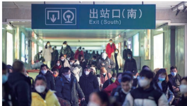
1月2日，旅客從南京火車站出站口出站。