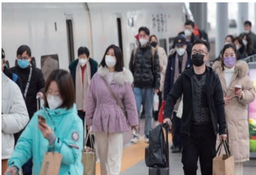
1月2日，旅客在南京火車站乘車。