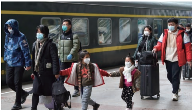
1月2日，剛下車的旅客在南京火車站準備出站。

【新華社】當日是元旦小長假最後一天，外出游玩、探親的旅客陸續返程，鐵路迎來返程客流高峰。