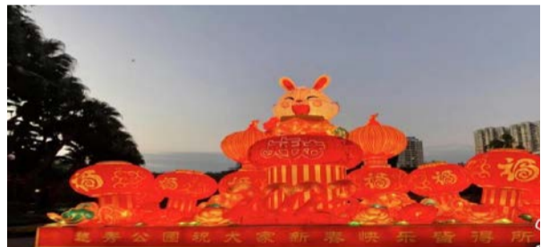
越秀公园迎春花灯亮灯

广州越秀公园迎春花灯19日晚正式亮灯，满载羊城记忆的千年越秀山张灯结彩、流光璀璨，吸引了众多游客入园观赏。