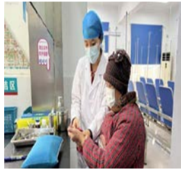
王陈思协助老人就诊。