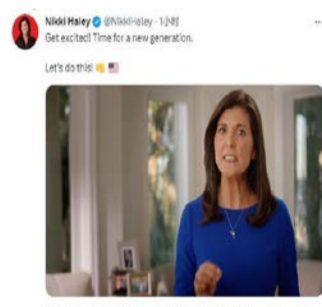
美国前驻联合国大使妮基黑莉社交媒体截图。

目前，其他可能考虑入主白宫的共和党人包括前副总统彭斯、前国务卿蓬佩奥、新罕布什尔州州长克里斯·苏努努、前阿肯色州州长阿萨·哈钦森、前马里兰州州长拉里·霍根、前新泽西州州长克里斯·克里斯蒂，以及南卡罗来纳州参议员蒂姆·斯科特。