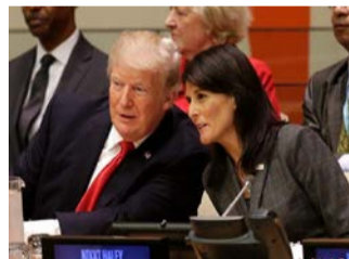
美国前总统特朗普与前驻联合国大使黑莉（右）