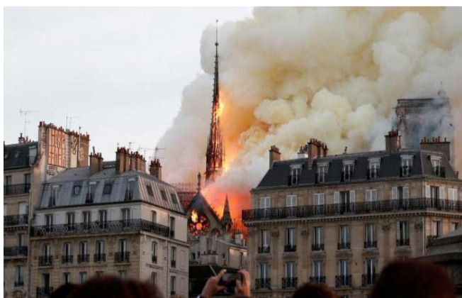
2019年4月15日，巴黎圣母院大教堂的塔尖被大火吞噬。