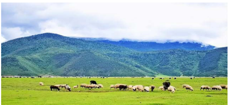
云南省迪庆藏族自治州香格里拉网图

前不久，迪庆藏族自治州党政代表团前往上海招商引资，文旅产业成为重点方向。目前，滇藏铁路丽江到香格里拉段的建设已经进入最后的冲刺期，独具民族特色的香格里拉站站房正静待游客到来。“随着丽香铁路的开通，迪庆的旅游业必将迎来新的黄金期，我们将通过旅游业的高质量发展，带动迪庆全域经济发展、民生持续改善。”高翔说。