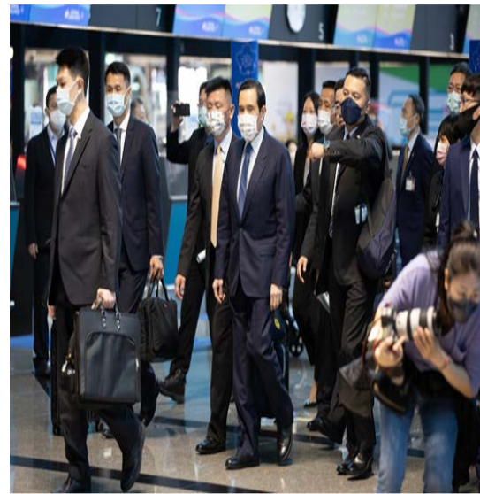
图：台湾地区前领导人马英九3月27日下午率团赴大陆祭祖、交流。据悉，马英九此次行程往返共计12日，计划访问南京、武汉、长沙、重庆、上海等五个城市。

在桃园机场等待出发时，马英九表示，自37岁在台当局处理两岸事务起，等待赴陆行已等了36年，“虽然久了点，但很高兴能去”。这是马英九第一次访陆，在两岸关系处在低谷的时刻成行绝非易事，但同过去许多台湾政治人物的“第一次”一样，都将为两岸和谐往来做出贡献。