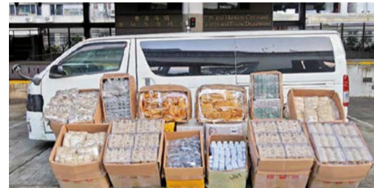
图：海关日前侦破一宗涉嫌利用快艇走私的案件，检获一批怀疑走私物品，并扣查一辆怀疑涉案货车。

海关前日在大屿山附近海域侦破一宗利用快艇走私的案件，检获市值约3800万元走私物品，包括电子零件、燕窝、干花胶等，并扣查一辆轻型客货车。