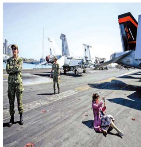
图：一名女子28日在美国航空母舰“尼米兹”上自拍。

综合美联社、路透社报道：美国海军核动力航空母舰“尼米兹”号28日驶入韩国东南部的釜山作战基地。此前，“尼米兹”号领衔的第11航母打击群在济州道以南公海与韩国海军进行了联合海上演习。