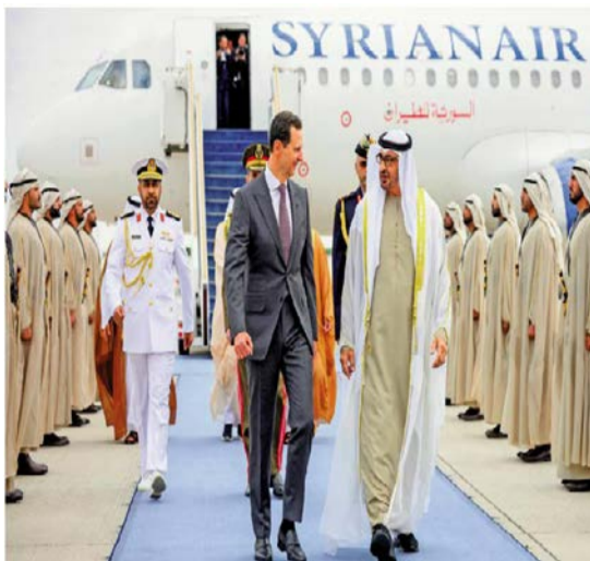
图：阿联酋总统穆罕默德（右）19日与到访的叙利亚总统巴沙尔会晤。

中国外交部24日表示，中方对叙利亚和沙特就重开两国使馆表示欢迎。中方坚定支持阿拉伯国家加强团结协作，增强战略自主，共同促进地区的和平、稳定与发展。