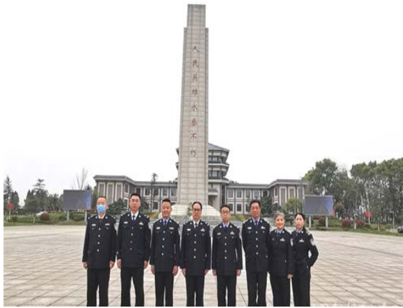
在革命烈士陈列馆和陵园墓碑前，同志们认真观看了革命烈士的英勇事迹。