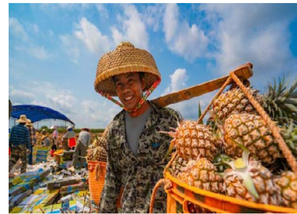
徐闻县果农喜获菠萝丰收

黄执孔表示，徐闻将围绕菠萝这一土特产，持续做文章，做深做透，以产业振兴推动产业高质量发展。