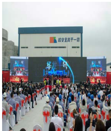
我国西部地区首台“华龙一号”核电机组正式投产仪式现场。