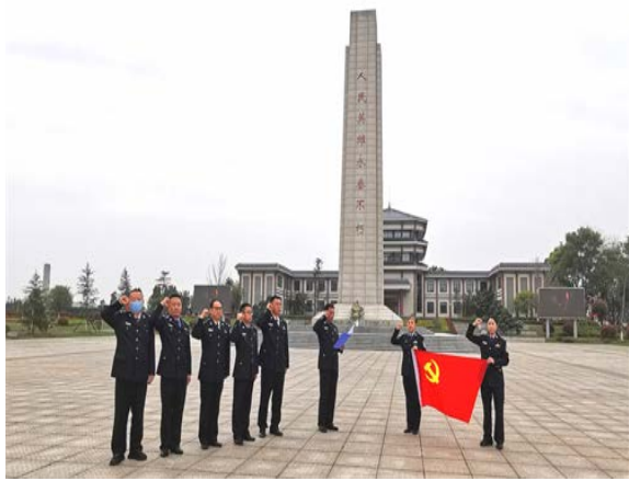
3月28日下午15时许，警务部全体党员来到革命陵园祭奠革命先烈，集体向革命烈士鞠躬默哀，敬献鲜花。