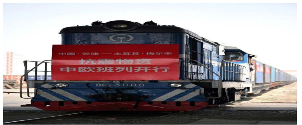
3月29日，首趟天津至土耳其中欧班列开行