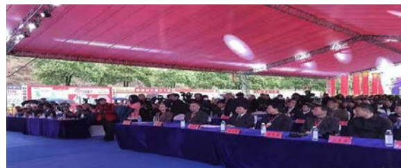
4月6日，邵东第七届五金机电博览会开幕式现场

4月6日，2023年湖南省邵东市第七届五金机电博览会开幕，来自全球20多个国家的1000余家企业参展，参展品种3500余个。