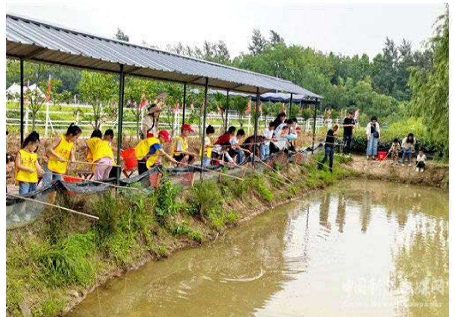
图为游客垂钓现场

捕捞、品尝等方式，把小龙虾和乡村旅游结合起来。一只小龙虾带火了一个产业，“龙虾休闲趣味垂钓+特色农庄”渐成庐江乡村旅游的新亮点。