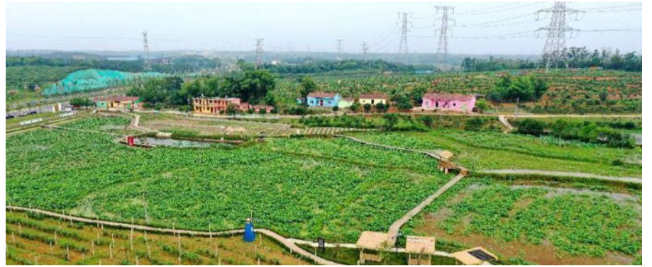
图为江西共青城市江益镇跃进村“陌上花开”景区一角。

“我们这里既有秀美风光，又有丰富的农产品，还有为年轻人创业提供的平台空间。”江益镇党委副书记黄杰称，跃进村通过引导乡贤发力，依托区位优势，盘活土地资源，大力发展农文旅产业，激活“美丽经济”，走出了一条有特色的乡村振兴之路。