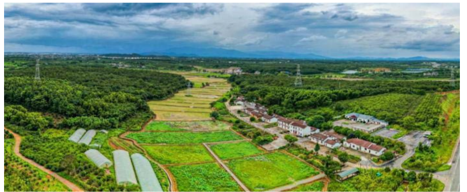
图为江西共青城市江益镇跃进村“陌上花开”景区一角。