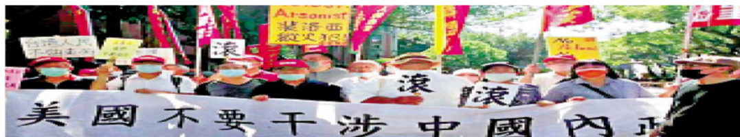
图:台湾民众在岛内举行集会,批评美国插手台海问题。

李尚福还表示,中国有一首广为传唱的歌曲,歌词写道:朋友来了有好酒,豺狼来了有猎枪。李尚福说,中国始终致力于以实际行动促进世界和平发展。中方愿与各国携手同行现代化之路,为世界稳定繁荣提供新的机遇。