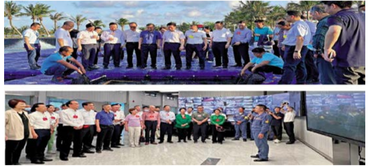
上图:港区全国人大代表调研组参观国家863基地,了解水产种苗研发和生产情况。下图:调研组到宝钢湛江钢铁有限公司参观,了解最新环保炼钢技术。

国家战略交汇点,站在国家发展战略的大舞台上,迎来空前的发展机遇。本月下旬,湛江计划在香港举办大型宣传活动,希望能够让更多香港朋友了解湛江,参与湛江建设并分享湛江发展机遇。