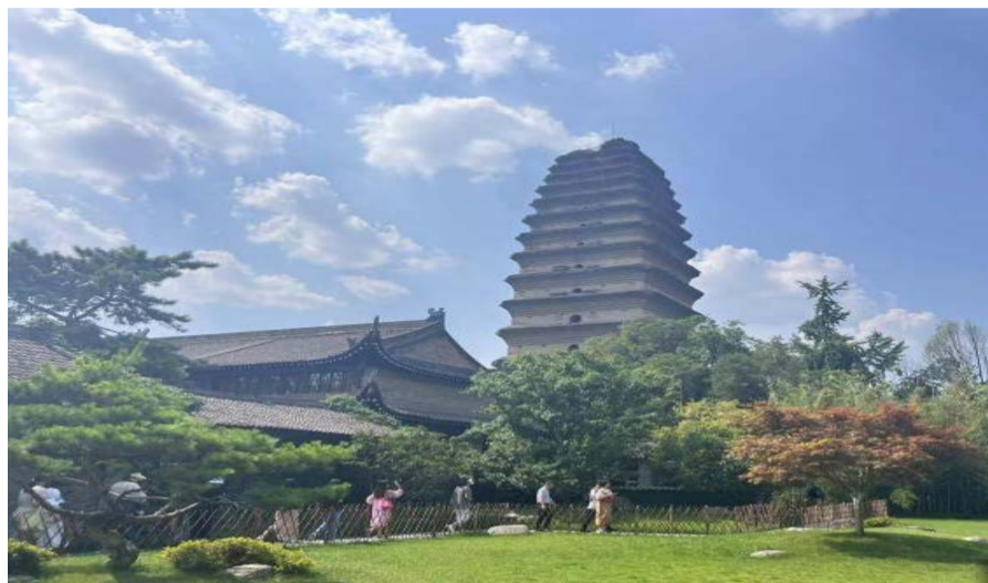
6月29日，西安小雁塔景区内民众正在游览。

旅深度融合，打造彰显中华文明的世界人文之都，也欢迎各地游客暑期“嗨”玩西安，感受这座千年古都的独特气质。