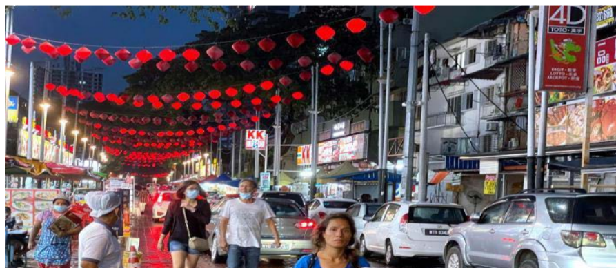
亚罗街受游客欢迎，每晚车流巨大（资料图）