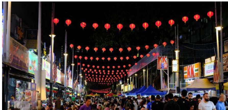
亚罗街吸引世界各地游客（资料图）

薛富丰表示，在改为夜间步行街后，除了食客安全得到进一步保障，也可令摊贩经营空间扩大，改善游客体验。