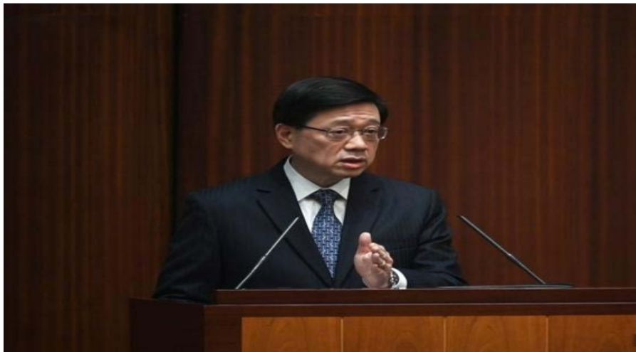
图为问答交流会现场。

李家超指出，感谢谭议员给了他首次在立法会用普通话回答的机会。对中资企业在建港方面的作用，特区政府的期望很高。中资企业在资金、网络、人才、资源等方面都可以发挥很大的力量，在文化艺术推展方面亦很有作为。随后，李家超向谭岳衡提问：“中资企业如何多发挥力量，推动香港文化产业化？”