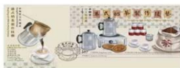
Serviced First Day Cover affixed with a $10 Stamp Sheetlet (date-stamped with associated special postmark). 貼有一張10元郵票小型張的已蓋銷首日封（以相關的特別郵戳蓋銷）。