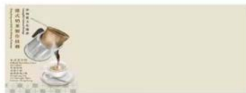
Official First Day Cover. 正式首日封。

Intangible Cultural Heritage - Hong Kong-style Milk Tea Making Technique 非物质文化遗产 - 港式奶茶製作技藝