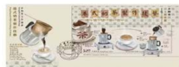
Serviced First Day Cover affixed with a $20 Stamp Sheetlet (date-stamped with associated special postmark). 貼有一張20元郵票小型張的已蓋銷首日封（以相關的特別郵戳蓋銷）。