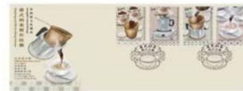
Serviced First Day Cover affixed with a set of mint stamps in four denominations (date-stamped with associated special postmark). 貼有一套四款面值郵票的已蓋銷首日封（以相關的特別郵戳蓋銷）。