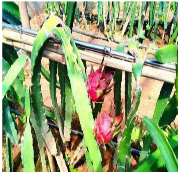
7月上旬，甘肃华亭市西华镇西塬村种植的火龙果陆续成熟上市。

每到周末或者午后，民众就会选择去采摘园，沉浸式体验采摘乐趣，精心挑选健康安全、新鲜可口的果蔬。