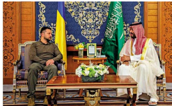
图：沙特王储穆罕默德（右）今年5月接待来访的泽连斯基。资料图片

卡舒吉2018年在沙特驻土耳其领事馆遇害，美国等西方国家指控沙特王储穆罕默德是幕后黑手，沙特方面坚决否认。