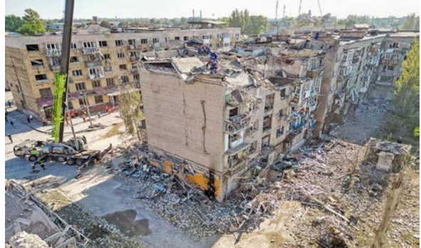
图：乌军在东部和南部战线进展缓慢。图为顿涅茨克地区被战火摧毁的建筑。

科林森表示，美国总统拜登正在制定一项新的援乌拨款法案，预计在年底之前提交国会审议。在众议院占优势的共和党是否愿意让这项法案通过，将是对美国援乌决心的一次重要考验。