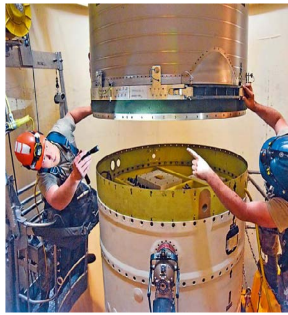
图：马姆斯特罗姆空军基地致癌物超标，图为技术人员连接洲际弹道导弹装置。