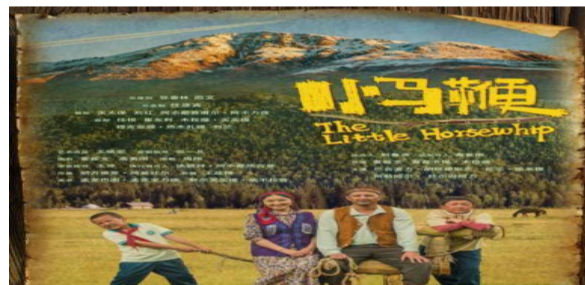
儿童电影《小马鞭》。