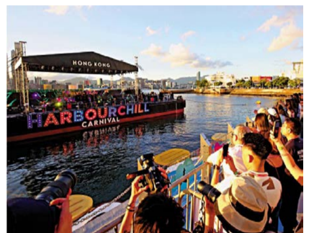
图：政府会举办更多大型盛事、设计更多不同路线吸引旅客。图为上月举行的维港水上音乐会。