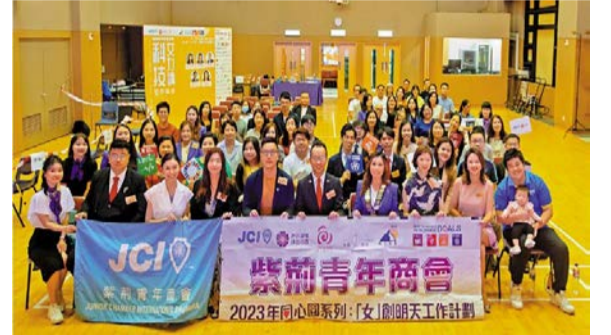
图：紫荆青年商会“‘女’创明天”工作计划设“科技女力讲”，倡议年轻人投身工程和科技界。