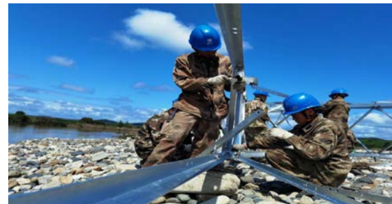
黑龙江电力抢修人员在海林市海林镇孟家村进行地面组装110千伏海长线三基铁塔。

据了解，为应对此次洪涝灾害，国网黑龙江电力累计投入抢修人员3253人、抢修车辆665台、应急发电车32台。截至目前，黑龙江省内因洪水供电受影响地区已全部恢复供电。