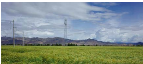
图为白朗县巴扎乡彭仓村青稞田。

县政府和山东援藏干部动员当地村民种植蔬菜，建大棚、送菜苗、教技术，传统农牧业逐渐向现代农业转型，作为白朗县第一个蔬菜大棚的诞生地，巴扎乡彭仓村经过多年探索和尝试成了县里的蔬菜种植样板村。