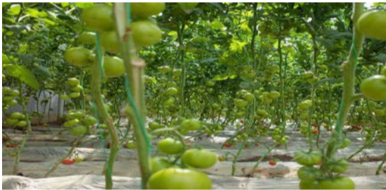
图为温室大棚内种植的西红。