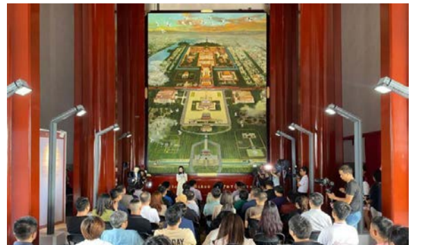
由著名画家刘宇一应邀创作的巨幅油画《壮美中轴》20日下午在北京正阳门城楼正式亮相，图为仪式现场。

此次创作由北京中轴线基金会与复兴之路文化艺术发展有限公司共同策划，中国紫檀博物馆捐赠画框底座并装裱画作。