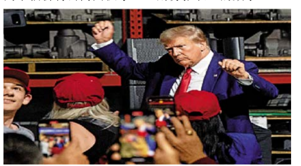
图：特朗普27日在密歇根州造势。

去年9月，纽约州总检察长詹姆斯对特朗普提起诉讼，要求对其罚款2.5亿美元，并禁止特朗普及其几位亲属经营公司。特朗普称法官对他“怀恨在心”，形容自己的身家“远超过财务报表上的数字”。