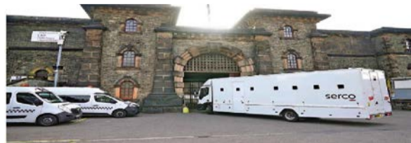
图：英国有犯罪分子卧底当狱警走私毒品获利。图为伦敦的旺兹沃思监狱全貌。

过去40年来，招募狱警的年龄限制已大幅降低。1999年，英国狱警的最低年龄降低至18岁。由于人手不足，狱警培训的时长也从10周缩短至7周。POA表示，在绝大多数监狱中，许多年轻狱警对走私违禁品进监狱习以为常，甚