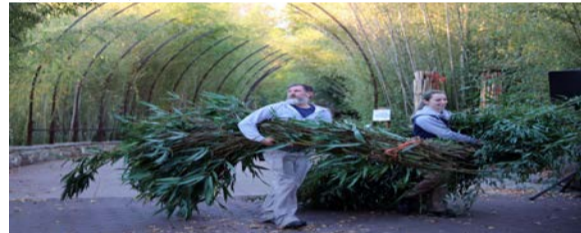
当地时间2023年11月8日，旅居华盛顿的三只大熊猫“美香”、“添添”和它们幼崽“小奇迹”启程回国。图为华盛顿史密森学会国家动物园工作人员为大熊猫的回国之旅搬运竹子。这次总共准备了大约100公斤的竹子。

当天清早，国家动物园工作人员将三只大熊猫分别装进三个特制的、每个重达360公斤的旅行箱，连同大约100公斤竹子、饮用水、苹果等水果和其他相关物资运上卡车。随后，车队驶离动物园，前往杜勒斯国际机场。