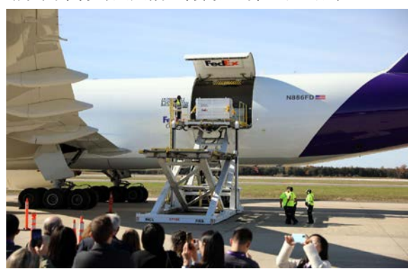
当地时间2023年11月8日登上一架联邦快递专机飞往成都。