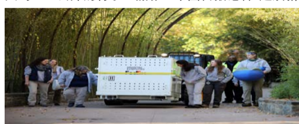
图为华盛顿史密森学会国家动物园工作人员将装着大熊猫的特制旅行箱运往卡车，然后卡车开往杜勒斯国际机场，从那里飞往中国。