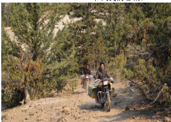
图为村民骑着摩托车往山上运送物资。

这片美丽的土地见证了森林消防队员们日复一日、年复一年的辛勤付出，他们用生命与汗水书写着对这片土地的热爱与执着，默默无闻地守护着这里的绿水青山，用炽热的心和坚定的信念，践行着对祖国和人民的忠诚。