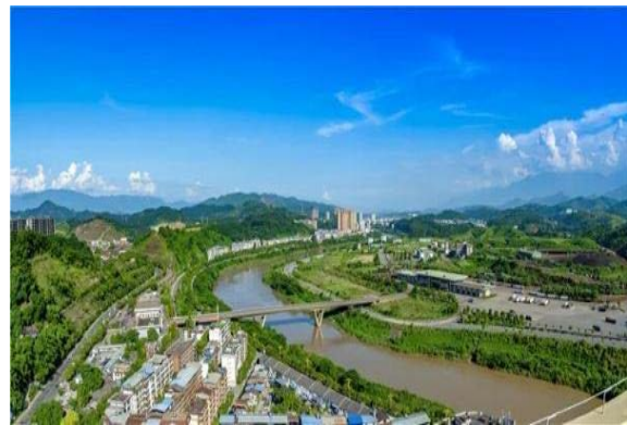
图为云南河口瑶族自治县网图