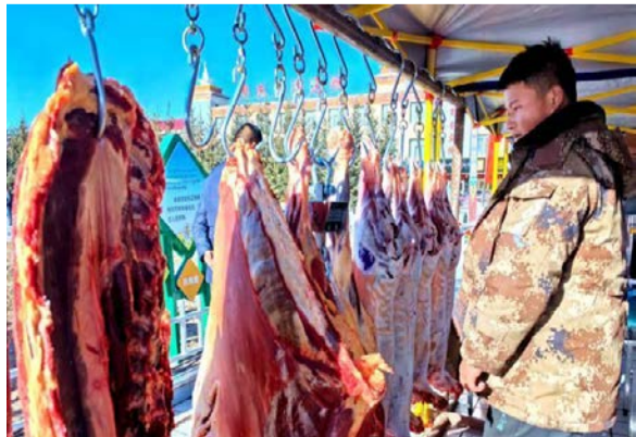
图为当地民众选购冬肉。

当日，该县成立了青海湖农牧投资开发有限公司，支持鲁援饲草料厂开发优质饲草料产品让利于养殖户，大力推广统一补饲、统一收购、统一加工、统一冷链储藏、统一销售的生产经营模式，支持国有企业高价收购牛羊，鼓励各类新型经营主体加工、生产、外销，着力推动农牧民增收、农牧业增效、农牧区繁荣。