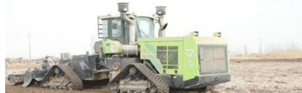
深耕粉碎松土作业改良土壤。