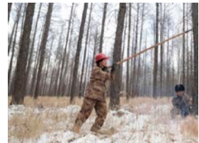
图为森林经营试点工作人员进行抚育采伐。

傍晚时分，工人们结束了一天的忙碌，返回帐篷驻地，将车辆、机具进行检修和维护，保证第二天安全作业。