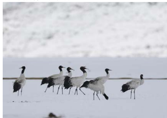
图为12月14日，纳帕海雪地中的黑颈鹤。

续降雪，至当日16时，雪深约20厘米。“如果持续几天降雪，湖面结冰等影响到候鸟觅食，我们将进行投食。”