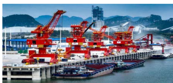
来宾港武宣港区龙从作业区装卸作业繁忙场景。