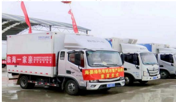
资料图为青海海晏首批绿色有机农畜产品进山东供销订单日前签约并发车。

的高品质“青字号”农产品。建设一批现代农业全产业链标准化示范基地和绿色有机原料生产基地，增强绿色有机农畜产品生产和输出能力。