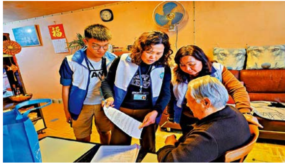
图：18 区议会伙同关爱队，将推出关爱大行动。图为友爱北关爱队探访长者送暖。

要的人带来温暖及关怀，让他们度过一个温馨的节日。而民政事务专员会也致力带领和协调区议会、“关爱队”及“三会”，相互为民生做实事，与市民携手共建美好社区，提升市民幸福感、获得感。