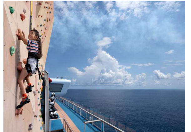
这是皇家加勒比“海洋光谱号”邮轮的海上攀岩墙(资料照片)。