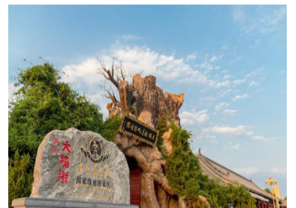
2023年,洪洞大槐树景区获评“山西省旅游服务标准化示范区”。

还制定卫生清洁服务标准,规定“在清洁过程中应留意周边环境,如遇游客经过,宜在游客临近作业位置约3米处停止作业,微笑并礼让示意游客通行”。