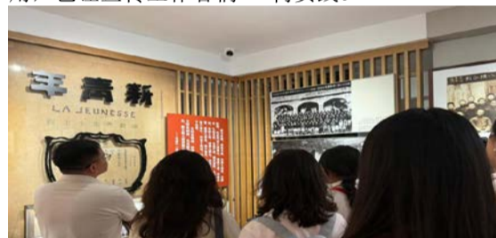
图为研学营队员在北大红楼参观。

“每个历史阶段的青年都有不一样的责任，整个展览于我而言就像一面镜子。”李生琦说，“前辈们摸着石头过河，而我们要努力在石头上开花。不管身处哪个时代，宣传舆论工作都起到了春风化雨、凝聚人心的重要作用，也让宣传工作者们