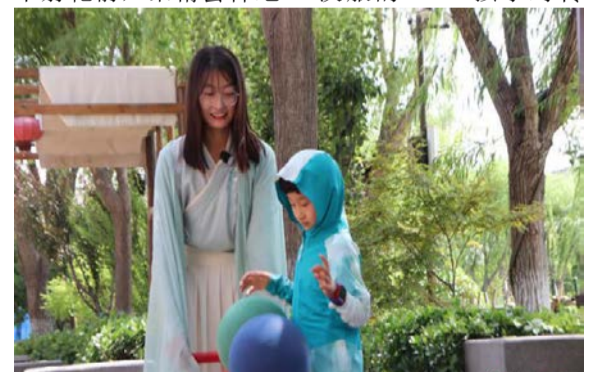
6月1日，记者变身游乐场NPC与小朋友互动。

在采访过程中，记者还遇到了许多家长。“今天带孩子来游乐场玩，没想到会遇到穿着汉服的NPC。孩子对传