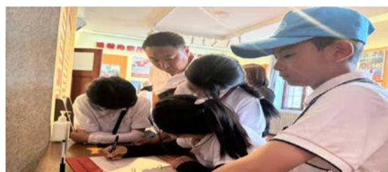
图为研学营队员在北大红楼参观后留下感言。