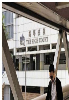
图：香港法院一直进行独立审判，不受任何干涉。图为高等法院和终审法院。

破坏香港法治的人是英国政府官员、政客和反华反港媒体，他们在审讯前、审讯期间和审讯后，公然恐吓制裁法官，公然践踏法治。特区政府从未亦不会容许任何人干预香港法官审讯，法院一直进行独立审判，不受任何干涉，过去是这样，现在是这样，将来也会是这样。不干预法院审讯案件是香港的基因。