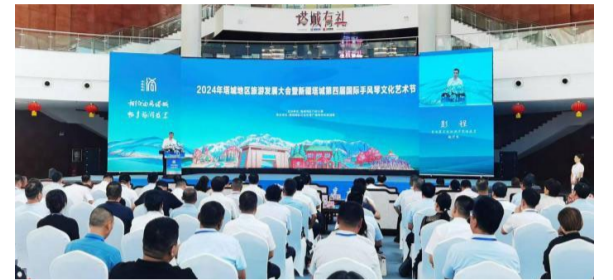
2024年塔城地区旅游发展大会暨新疆塔城第四届国际手风琴文化艺术节16日在塔城市举办。