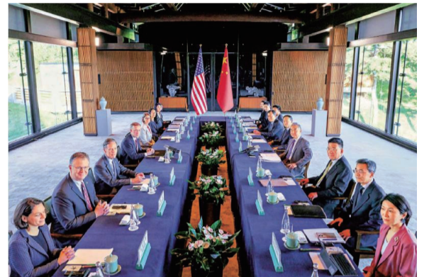
8月27日，中共中央政治局委员、中央外办主任王毅在北京同美国总统国家安全事务助理沙利文开始举行新一轮战略沟通。

针对美国总统国家安全事务助理沙利文访华，中国人民大学习近平新时代中国特色社会主义思想研究院副院长、太和智库高级研究员王