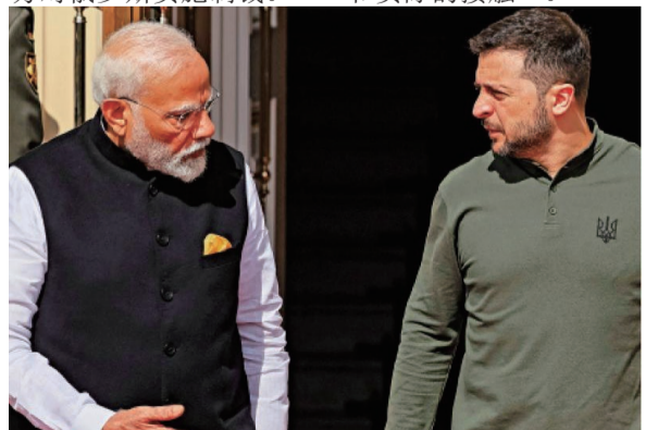
乌克兰总统泽连斯基(右)23日在基辅与到访的印度总理莫迪(左)会面。

印度向来与俄罗斯有紧密的经济和国防关系。2022年俄乌冲突爆发后，印度并未跟随西方对俄罗斯实施制裁。