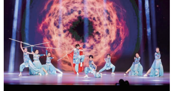
逾千名海内外舞者在珠海“金蝶”上演舞蹈盛宴。

据介绍，SDM爵士芭蕾舞学院在全港拥有24间分校，曾参与香港的新春花车汇演、“龙腾湾区欢乐年”等活动。