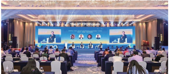
8月29日，第九届全球城市旅游振兴机构论坛在海南三亚举办。

中新网三亚8月29日电（张月和）第九届全球城市旅游振兴机构论坛（简称“TPO论坛”）29日在海南三亚举办。来自中国、韩国、马来西亚等国家的城市政府代表及联合国旅游组织等国际组织代表，共商全球城市旅游发展的新趋势、新机遇，推动构建可持续旅游目的地。