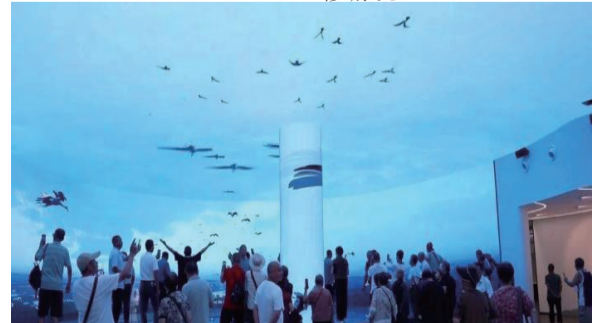
图为江西九江市永修县吴城候鸟小镇的鄱阳湖国际湿地候鸟馆迎来参观热潮。

据了解，永修县紧紧围绕“短途短期、开拓南昌都市圈”思路，坚定不移实施“全域旅游”发展战略，用心做好“处处皆景、四季宜游”文章，先后出台了“引客入永”等系列优惠政策，截至8月底，已经吸引数万名游客前来永修游玩。