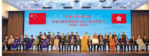
“香港宗教界庆祝中华人民共和国成立七十五周年大会”日前举行。

续在文化、教育、慈善、社会服务等方面发挥积极作用，引导广大信众真心拥护‘一国两制’，坚定支持特区政府依法施政，加快推进香港由治及兴。国家宗教事务局将一如既往支持两地宗教界扩大交流，深化合作，共同弘扬中华优秀传统文化，落实全球文明倡议，为推动人类命运共同体贡献智慧和力量。”