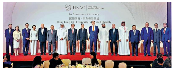
香港大使会昨日举行成立一周年志庆论坛，香港特区政府行政长官李家超出席并致辞。