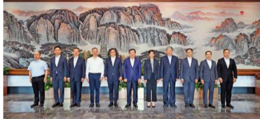
9月6日下午，中央港澳工作办公室主任、国务院港澳事务办公室主任夏宝龙在北京会见香港特区政府保安局局长邓炳强率领的香港纪律部队首长交流团。

交流团其他成员则于九月八日继续福建行程，于九月九日返港。交流团成员包括海关关长何珮珊、入境事务处处长郭俊峯、惩教署署长黄国兴、消防处处长杨恩健、政府飞行服务队总监胡伟雄、警务处副处长（行动）周一鸣和各部门首长级人员。